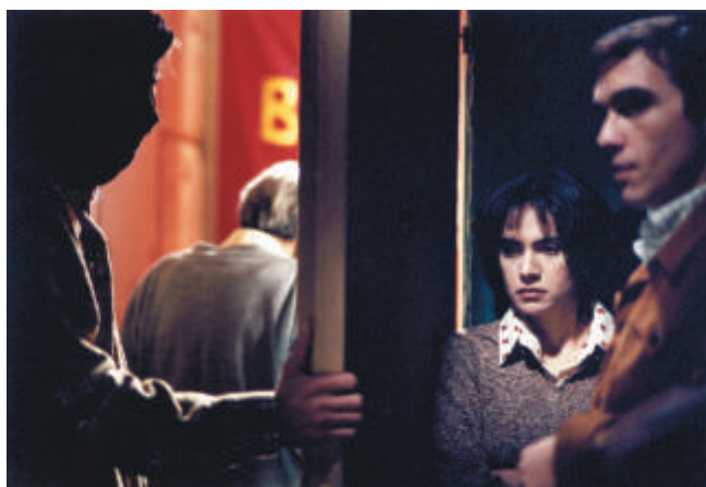
Cena de “Bom dia, noite”

Ato mais significativo da escalada de violência que o embate entre capitalistas e socialistas provocava no país, o seqüestro eleva a tensão política na Itália a níveis inéditos desde o fim da Segunda Guerra. É essa