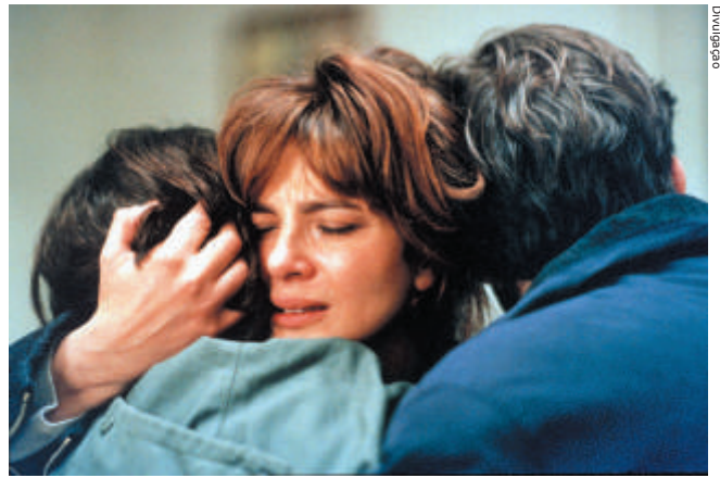
Cena de “O quarto do filho”

A primeira idéia a ser desfeita é a do filme italiano enlatado para exportação, aquele feito em geral por estrangeiros, no qual a trama se desenrola em vilas pitorescas, onde os habitantes gritam o tempo inteiro, dançam e choram sem muito motivo. Detalhes típicos surgem a todo o tempo, na obra, mas encaixam-se naturalmente numa história que ultrapassa a dimensão nacional, para focar o humano. Estão lá as ruelas estreitas, rodeadas de prédios centenários, as motocas dos adolescentes, as refeições desdobradas em três ou quatro etapas, a paixão pelo esporte, a valorização da família. Ainda assim, as personagens da história vivem uma rotina comum à maioria dos italianos. O pai, psicanalista, e a mãe, editora, trabalham duro, convivem com os filhos adolescentes e são carinhosos um com o outro. Os jovens, por sua vez, estudam, namoram e fazem das suas besteiras, de vez em quando.