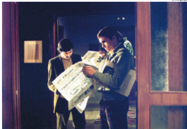
Cena de “Bom dia, noite”