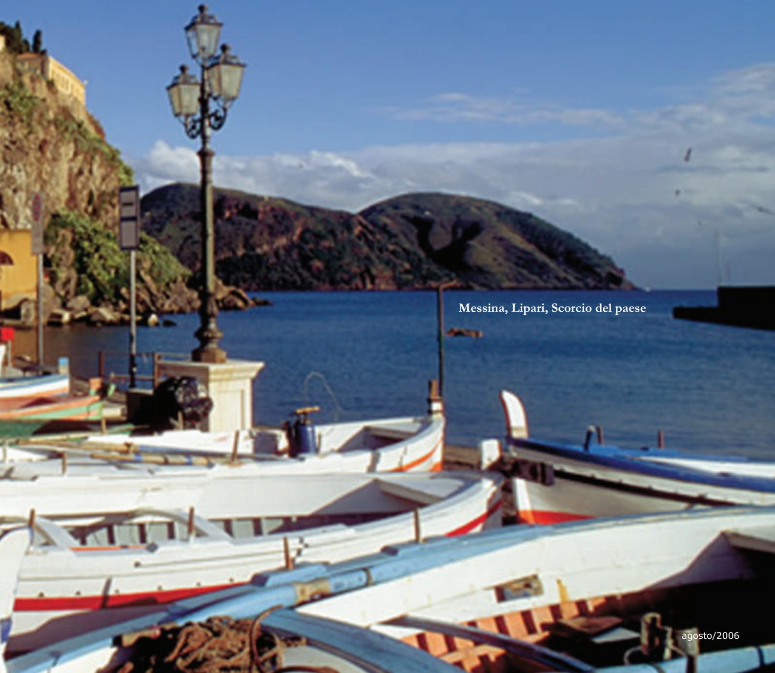
Messina, Lipari, Scorcio del paese

Maior ilha vulcânica mediterrânea, a Sicília tem identidade própria e atrai visitantes por sua peculiar riqueza arqueológica, cultural e histórica